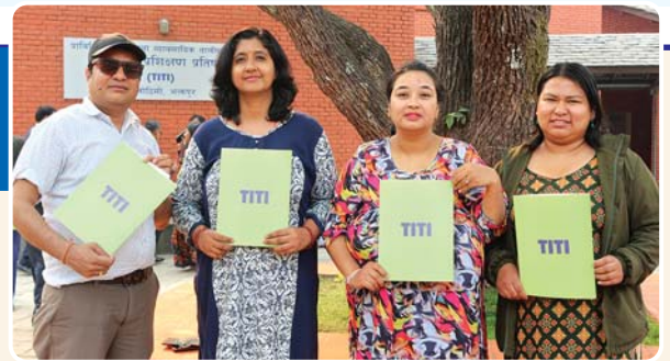
दिक्षित हुने केन्द्रका अधिकारीहरू

नेपाल सरकार प्राविधिक प्रशिक्षण प्रतिष्ठान भक्तपुरले प्रदान गरेको उक्त तालिम कोर्स नेपाल सरकारले मान्यता प्रदान गरेको कोर्स हो।