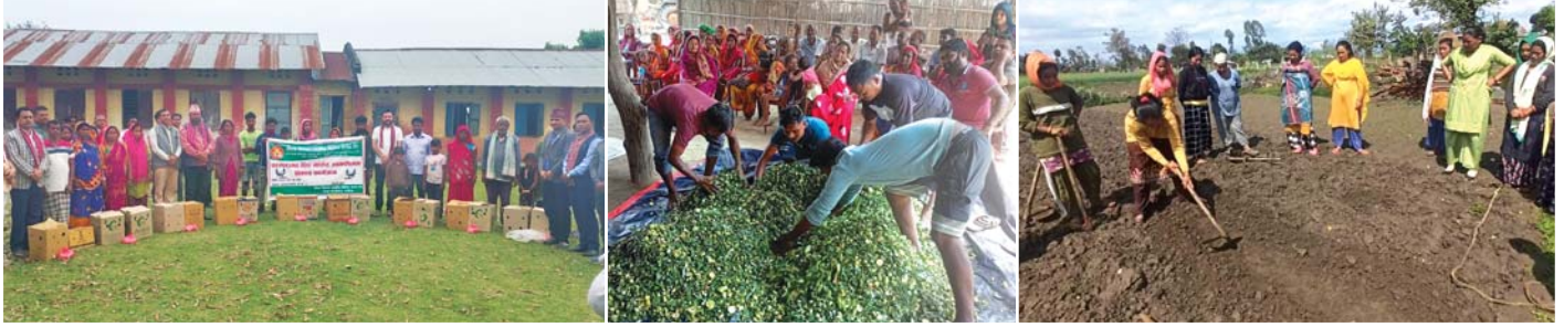
सीपमूलक तालिमका भ्रमणकर्ताहरू

प्रत्येक लघुवित्त सदस्य उद्यमी बन्नु पर्छ। त्यसका लागि सदस्यले संस्थाबाट लिएको ऋण उत्पादनशील क्षेत्रमा लगानी गर्नु पर्छ। यसले सदस्यहरू ऋणको भारले थिचिनु पर्दैन। एउटा संस्थाको ऋण तिर्न अर्को संस्था गुहार्नु पर्दैन। लगानी उत्पादनशील क्षेत्रमा भयो भने सदस्य समृद्ध बन्छ भने कर्जा असुली सुनिश्चित भई लघुवित्त संस्था पनि दिगो हुन्छ। यही सन्दर्भमा लघुवित्तका महिला सदस्यलाई उद्यमी बनाउने लक्षका साथ स्वावलम्बन विकास केन्द्रले लघुवित्तका महिला सदस्यलाई उद्यमी बनाउन उद्यमशीलता विकास कार्यक्रम अगाडी बढाएको छ।