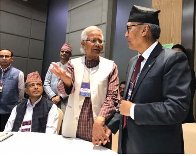
प्रो. युनूस र केन्द्रका अध्यक्ष बीच भलाकुसारी

प्राणीजगतको लागि हानिकारक अभ्यासहरू बन्द गरी दिगो र समाज प्रति उत्तरदायी आर्थिक प्रणाली शुरुवात गर्न के कस्ता सम्भावना तथा अवसरहरू हुन सक्छन् भन्नेमा सम्मेलन केन्द्रित थियो। यसलाई ध्यानमा राख्दै पहिलो दिनको कार्यक्रममा क्रमशः वर्तमान स्वनाशक सभ्यताबाट बाहिर निस्कने उपायहरूको सदृढिकरण, नयाँ सभ्यता निर्माणको लागि सामाजिक व्यवसाय र लघुवित्त र खेलकुद र शान्तिः शान्तिपूर्ण र समावेशी समाज निर्माणका लागि खेलकुद विषयक तीनवटा विषयगत सत्रहरू सम्पन्न भएका थिए।