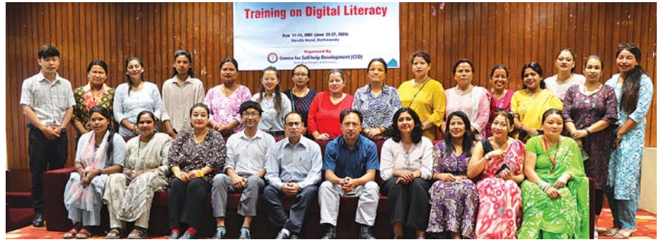
काठमाडौँमा सम्पन्न तालिममा सहभागीहरू

जस अनुसार केन्द्रले शहरी तथा अर्ध शहरी क्षेत्रका लघुवित्त सदस्य लक्षित २ वटा डिजिटल साक्षरता तालिम कार्यक्रम सम्पन्न गरेको छ। उक्त तालिमबाट ५७ जना लघुवित्तका उद्यमी सदस्यहरू लाभान्वित भएका छन्। २०८१ आषाढ ११ देखि १३ सम्म काठमाडौँमा सम्पन्न पहिलो तालिम बाट ७ वटा लघुवित्त संस्थाका १८ जना र २०८१ साउन ३१ देखि भाद्र १ सम्म भ्रापामा सम्पन्न तालिमबाट सहारा नेपाल साकोसका ३९ जना सदस्यहरू लाभान्वित भएका छन्। विगतमा समाजको आर्थिक सामाजिक संरचनामा पछि परेको लघुवित्तको लक्षित वर्ग पनि डिजिटल प्रविधिको पहुँचमा रहेर सम्पन्नता तर्फ लम्किन सकोस भनेर यस तालिम कार्यक्रमको थालनी गरिएको हो।