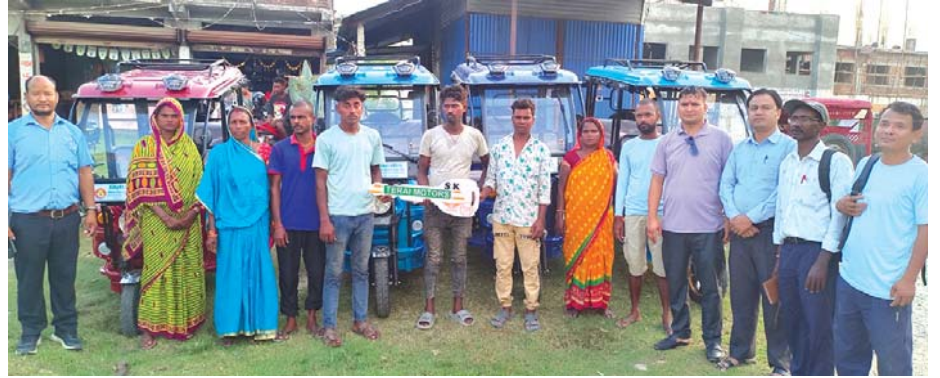
रिक्सा हस्तान्तरण कार्यक्रमको भ्रमक