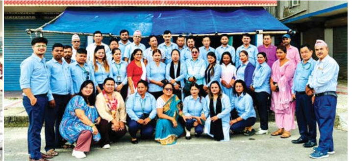
नवोदयमा सम्पन्न तालिमका सहभागीहरूको सामूहिक तस्वीर

केन्द्रले क्षेत्रियस्तरमा पुगेर लघुवित्तकर्मीहरूको क्षमता विकास गर्ने उद्देश्यले भापा जिल्लामा साउनमा दुईवटा तालिमहरू आयोजना गरेको थियो। जसमध्ये पहिलो तालिम साउन २४ देखि २६ सम्म चारपाने, भापामा सहारा नेपाल बचत तथा ऋण सहकारी संस्था लिमिटेडका कर्मचारी र २०८१ साउन २७ देखि २९ सम्म नवोदय बहुउद्देश्यीय सहकारी संस्था लि.का कर्मचारीहरूको लागि केर्खामा आयोजना गरिएका थिए। शाखा प्रबन्धक तथा फिल्ड कर्मचारी लक्षित उक्त तालिमहरूमा सहारा नेपाल साकोस लि. बाट ३० जना र नवोदय बहुउद्देश्यीय सहकारी संस्थाबाट ३५ जना गरी ६५ जना