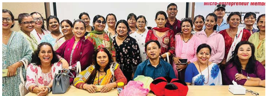
भ्रापामा सम्पन्न तालिमको भलक