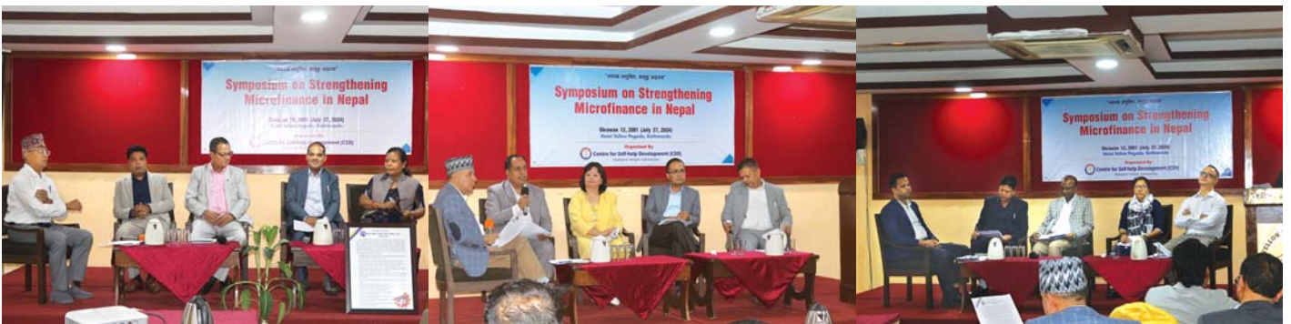
पानेल छलफलका भ्रमक

सम्बन्ध विस्तार गर्ने, संस्थाहरूमा नयाँ सदस्य बनाउने भन्दा भएकालाई सक्रिय बनाउन जोड दिने जस्ता निष्कर्ष यस सत्रले निकालेको छ।