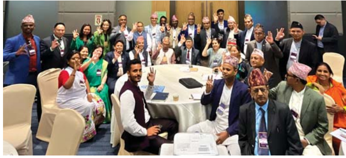
तीन शून्यको प्रतिबद्धता जनाउँदै नेपाल कन्ट्री फोरमका सहभागीहरू प्रो. युनूससँग

कन्ट्री फोरममा मलेसियाको लांकावीमा सम्पन्न भएको १३औं सामाजिक व्यवसाय दिवसमा नेपाल कन्ट्री फोरमले तयार पारेको ८ बुँदे कार्ययोजनाको प्रगति समीक्षा गर्नुको