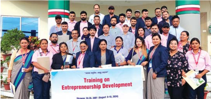
सहारा नेपाल साकोसमा सम्पन्न तालिमको भ्रमक