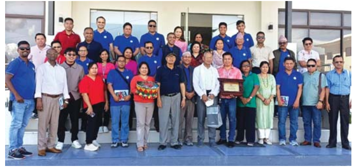
नेपाली भ्रमण टोली आशिको मुख्यालयमा

यसै गरी लघुबीमा कार्यक्रमको एक भागको रूपमा आशिले आफ्ना सदस्यहरूलाई बीमा कार्यक्रममा समेटेको छ । जसले कुनै अप्रिय अप्रत्याशित घटना भएमा सदस्यहरूको परिवारले क्षतिपूर्ति पाउने सुनिश्चित गरेको छ । यसको साथै आशिले आफ्ना सदस्यहरूका लागि